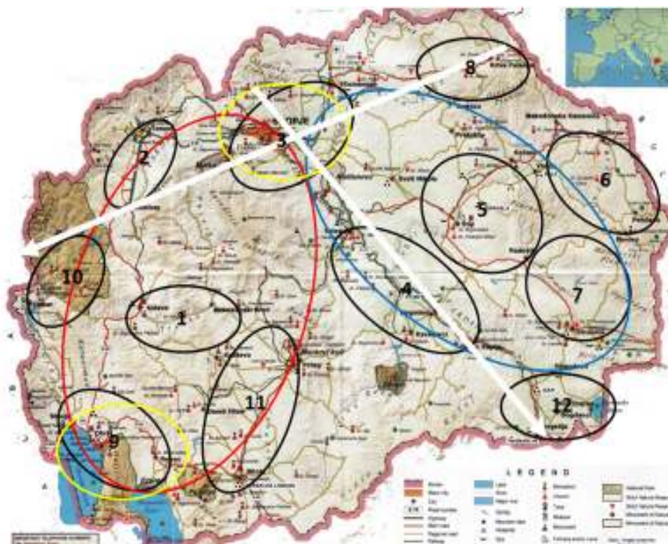
Harta e Maqedonisë e cila tregon klasterët/korridorët e mundshëm të turizmit

- Logji mbi Ujërat (Fletorja zyrtare Nr. 87/08, 6 / 09, 161/09, 83/10, 51/11, 44/12, 163/13)